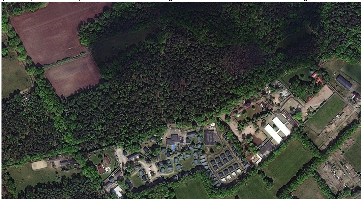
Mei 2022 (aan de noordzijde van het Landgoed zijn de lichtgroene esdoorns nog zichtbaar)

Gebleken is dat er op het perceel kadastraal bekend Gemeente Haalen, sectie A, nr. 4554 bomen zijn geveld. Uit kaart-, luchtfoto en veldonderzoek is gebleken dat het bij gaat om een velling van (Noorse) esdoorns. Op onderstaande afbeeldingen is de situatie van voor en na velling zichtbaar.