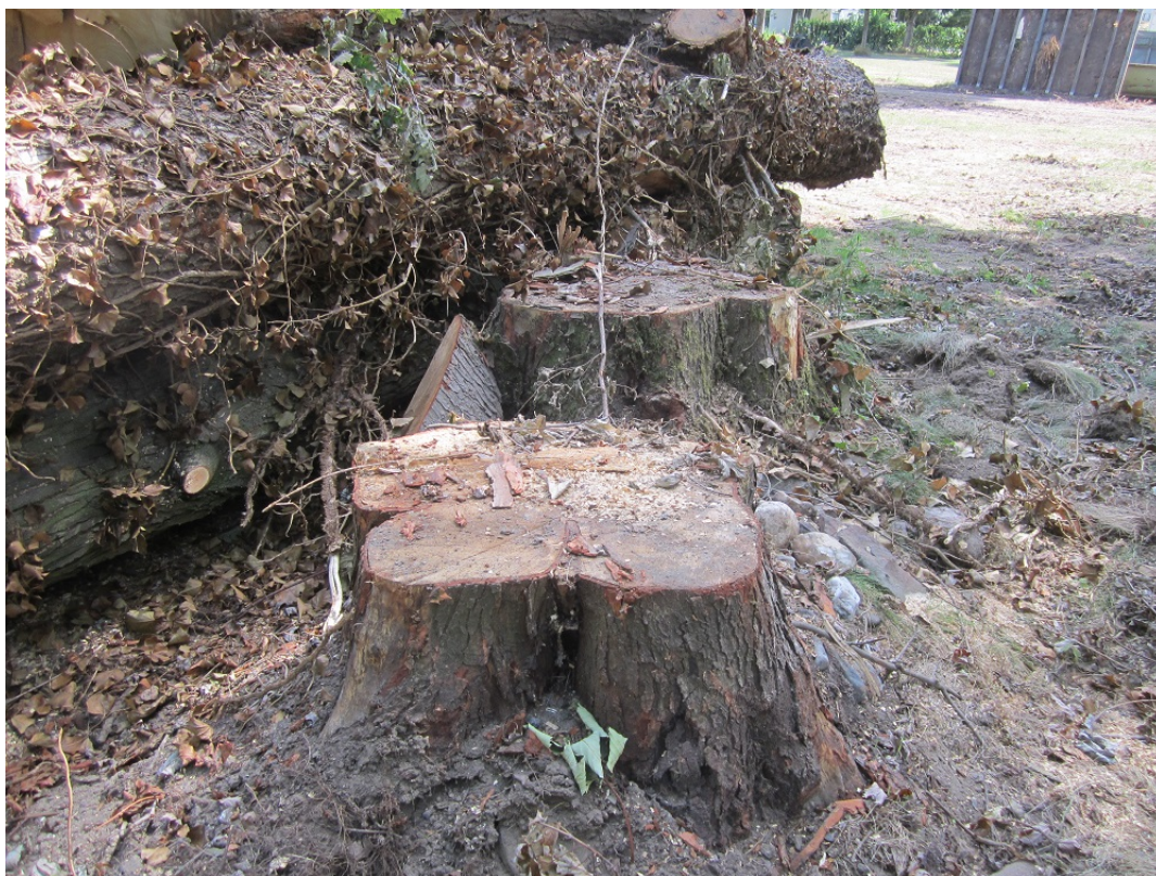
Situatie op 28 juli 2022