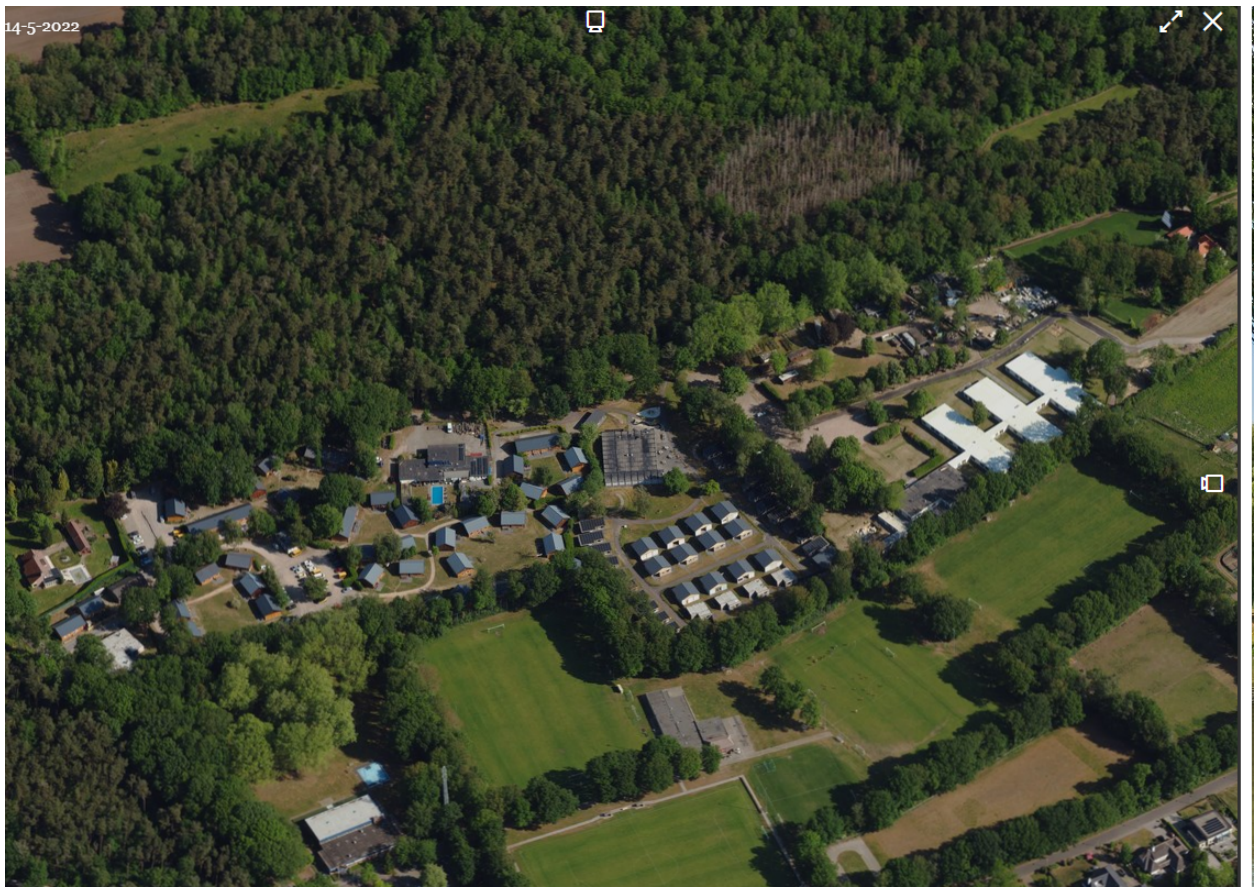
Obliquefoto d.d. 14 mei 2022

Opgemerkt wordt dat er op 5 september 2016 een kapmelding (zie volgende pagina) in het kader van de toenmalige Boswet bij het toenmalig bevoegd gezag RVO werd ingediend door vellingsfirma Peeters uit Kessel. De kapmelding had een geldigheidsduur van één jaar. Er werd toen echter geen gebruik gemaakt van de kapmelding. Nadien werd er echter geen nieuwe kapmelding meer ingediend. Opgemerkt wordt dat in voornoemde kapmelding eveneens melding werd gemaakt van de voorgenomen velling van fijnsparren op een naburig perceel (Gemeente Haelen, sectie A, nrs. 3 t/m 5). Ook voor deze fijnsparren werd geen gebruik gemaakt van de kapmelding uit 2016. Van deze nog aanwezige maar dode fijnsparrenhoutopstand is een separaat controlerapport opgesteld.