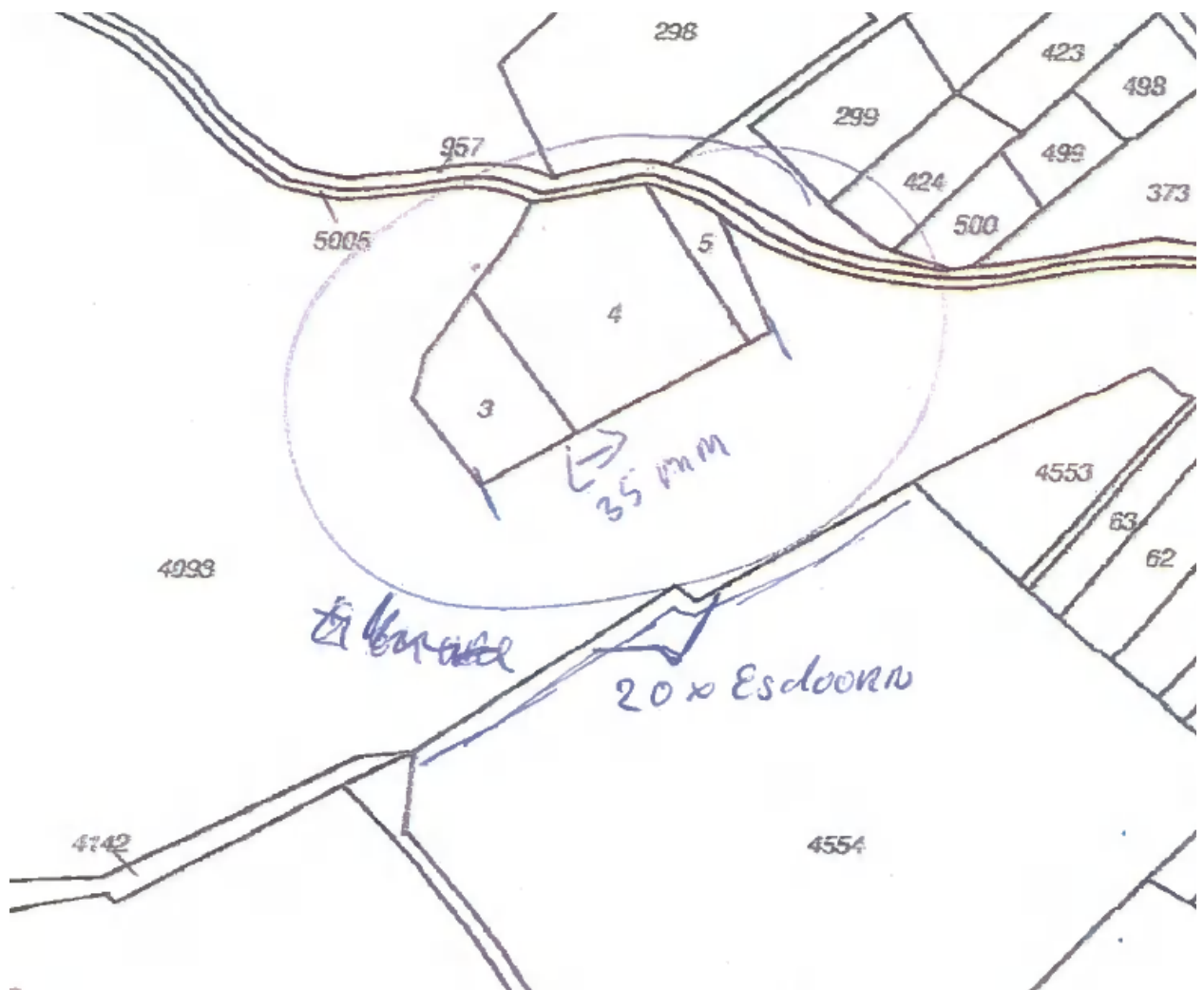
Uitsnede van de kapmelding d.d. 5 september 2016

N.a.v. een melding omtrent velling van voornoemde esdoorns heb ik op 2 november 2022 een controlebezoek gebracht aan de vellingslocatie en aan de locatie van de nog reeds aanwezige inmiddels dode fijnsparren (percelen 3 t/m 5). Mij is gebleken dat de esdoorns waar in het verleden een (vervallen) kapmelding voor was ingediend inmiddels geveld zijn zonder dat er 6 weken vooraf een kapmelding zoals bedoeld in de Wet natuurbescherming was ingediend.